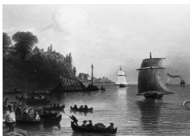
Gravure de W.H. Bartlett illustrant l'arrivée d'habitants à Trois-Rivières. Vers 1840. Au loin on aperçoit un navire à vapeur.

Les transports au XIX e siècle : une révolution https://rcffe13630.racontr.com/6bateauvapeur.html